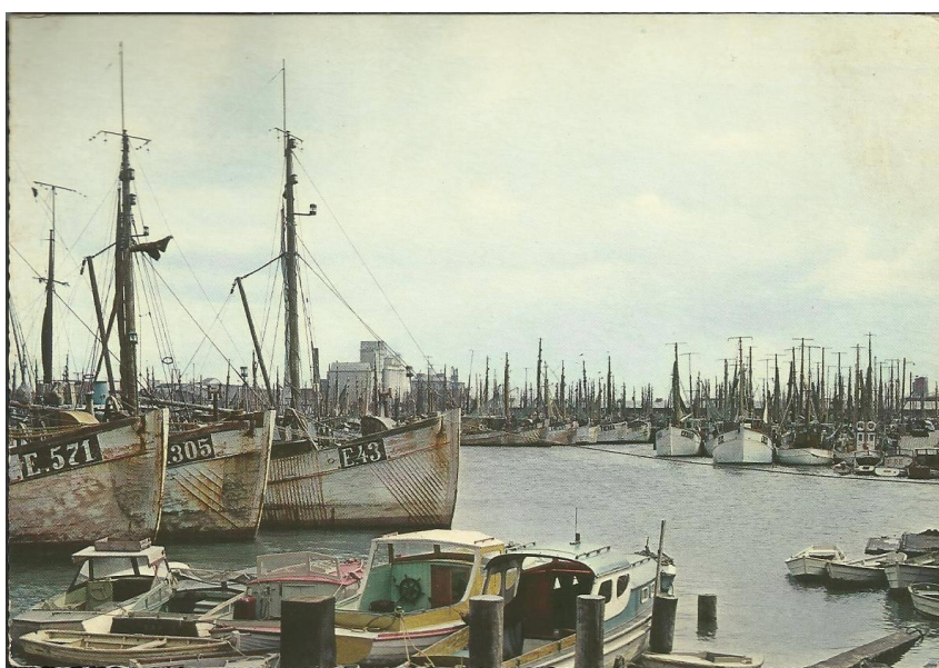
Fra de gode gamle dage.